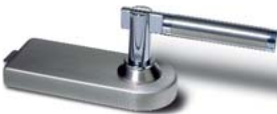
SET 3 • Schloss und Bänder, Messing velour vernickelt mit Türdrücker Messing poliert verchromt/Nickel matt