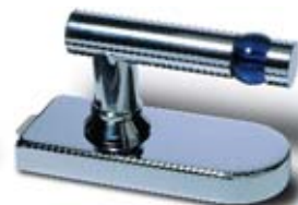
Türdrücker 22.124.0000.399 auf Fallenschloss Türdrücker vorn