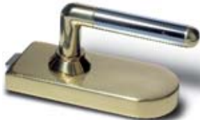
SET 2 • Schloss und Bänder, Messing poliert mit Türdrücker Messing poliert/Messing poliert verchromt