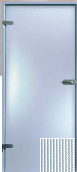
Strukturiertes Glas sgg MASTER-POINT Beschlag: Türdrücker 22.100.0000.--- auf Fallenschloss Türdrücker vorn