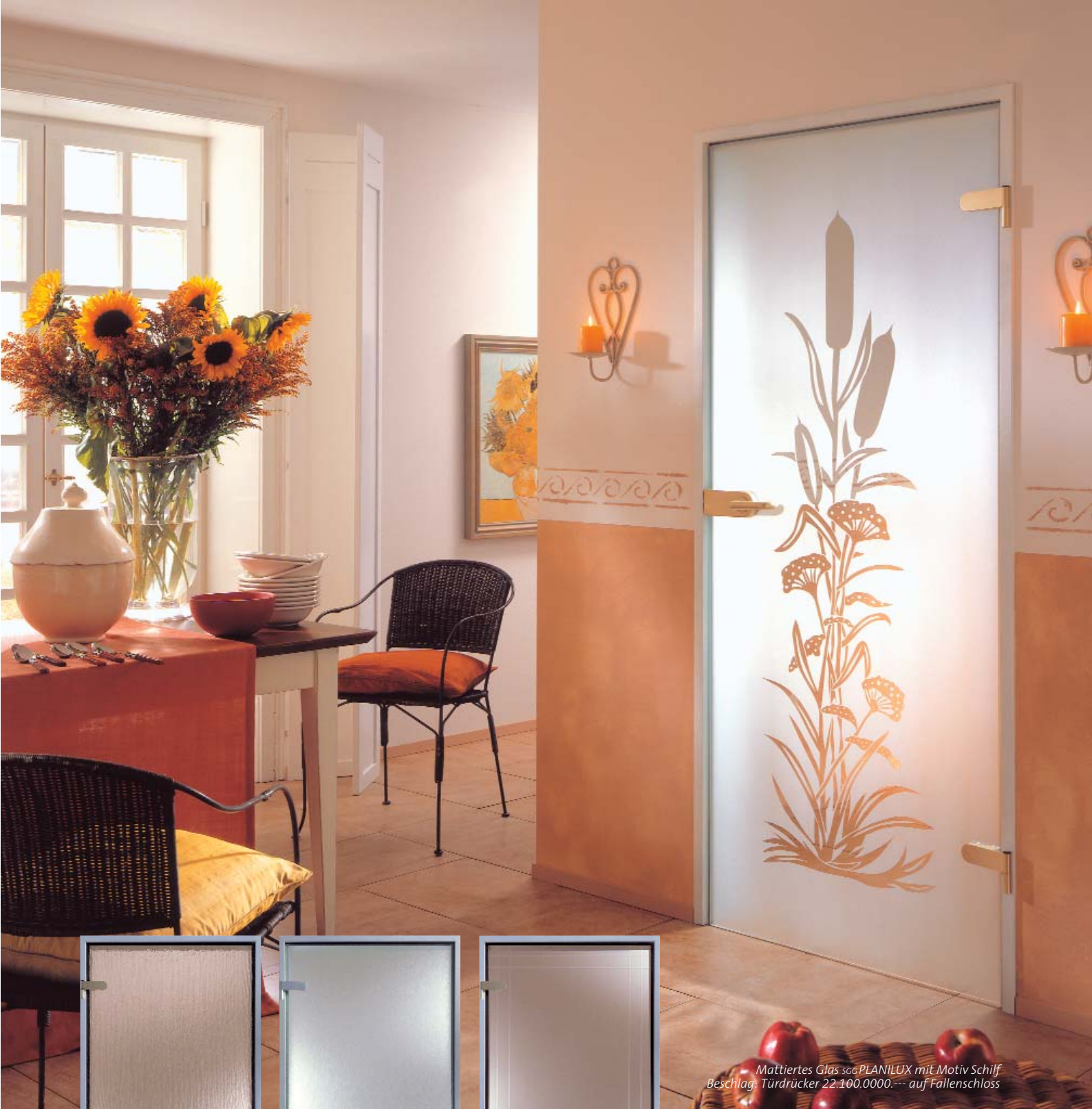
Mattiertes Glas sgg PLANILUX mit Motiv Schilf Beschlag: Türdrücker 22.100.0000.--- auf Fallenschloss