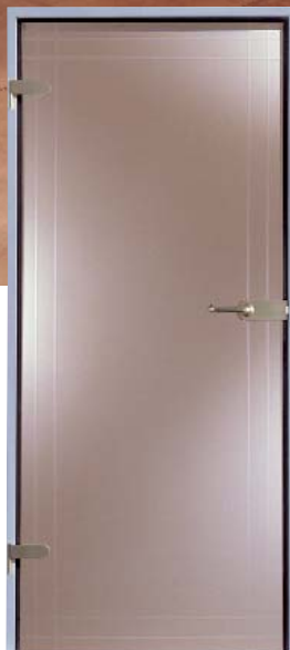
Gefärbtes Glas sgg PARSOL BRONZE mit Doppelrillenschliff Beschlag: Türdrücker 22.100.0000.--- auf Fallenschloss

Der Landhaus-Stil ist in Wohnhäusern wegen seiner gelungenen Mischung aus Romantik und Rustikalität weit verbreitet. Unterstrichen wird dieser Stil durch Türen mit großflächigen Naturmotiven, traditionell-handwerklichem Schliff oder natürlich wirkendem Ornamentmuster.