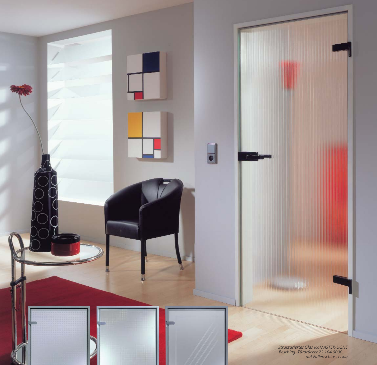
Strukturiertes Glas sGG MASTER-LIGNE Beschlag: Türdrücker 22.100.0000.--- auf Fallenschloss eckig