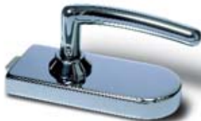
SET 5 • Schloss und Bänder, Messing poliert verchromt mit Türdrücker Messing poliert verchromt