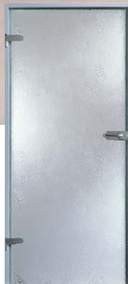
Strukturiertes Glas sgg PAINT Beschlag: Türdrücker 22.100.0000.--- auf Fallenschloss Türdrücker vorn

Frech, flott, cool, mit klarer Linie: jung und modern eben. Dazu passend der Eingang zu diesem Reich: ein klares Glas mit klar gezeichneten Mustern, strukturiertes Glas mit originellen Designs oder interessanter Bedruckung.