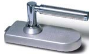
SET 7 • Schloss und Bänder, LM edelstahlfarbig matt mit Türdrücker Messing poliert verchromt/Edelstahl matt