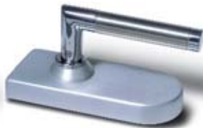
SET 6 • Schloss und Bänder, LM silber feinpoliert mit Türdrücker Messing poliert verchromt/Edelstahl matt