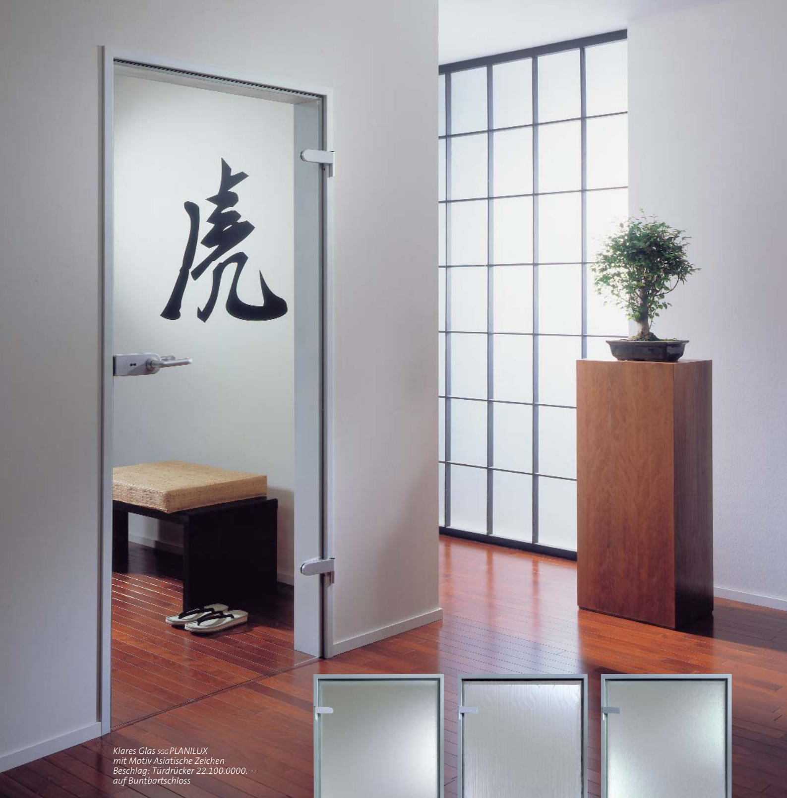
Klares Glas sggPLANILUX mit Motiv Asiatische Zeichen Beschlag: Türdrücker 22.100.0000.--- auf Buntbartschloss

Viele Einrichtungsgegenstände aus asiatischen Kulturkreisen sind im europäischen Wohndesign heimisch. sggCLARIT bietet dazu passende Designs, etwa mit japanischen Schriftzeichen verzierte klare Gläser oder Strukturen mit ansprechenden Ornamenten.