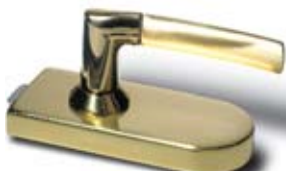
Türdrücker 22.116.0000.399 auf Fallenschloss Türdrücker vorn