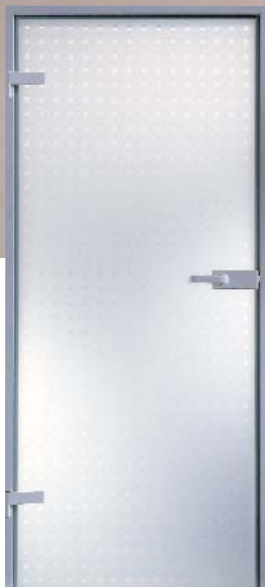
Mattiertes Glas sgg PLANILUX mit Motiv Quadrate FQ 088 Beschlag: Türdrücker 22.104.0000.--- auf Fallenschloss eckig