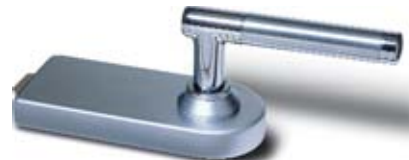
SET 8 • Schloss und Bänder, Messing matt verchromt mit Türdrücker Messing poliert verchromt/Messing satiniert verchromt