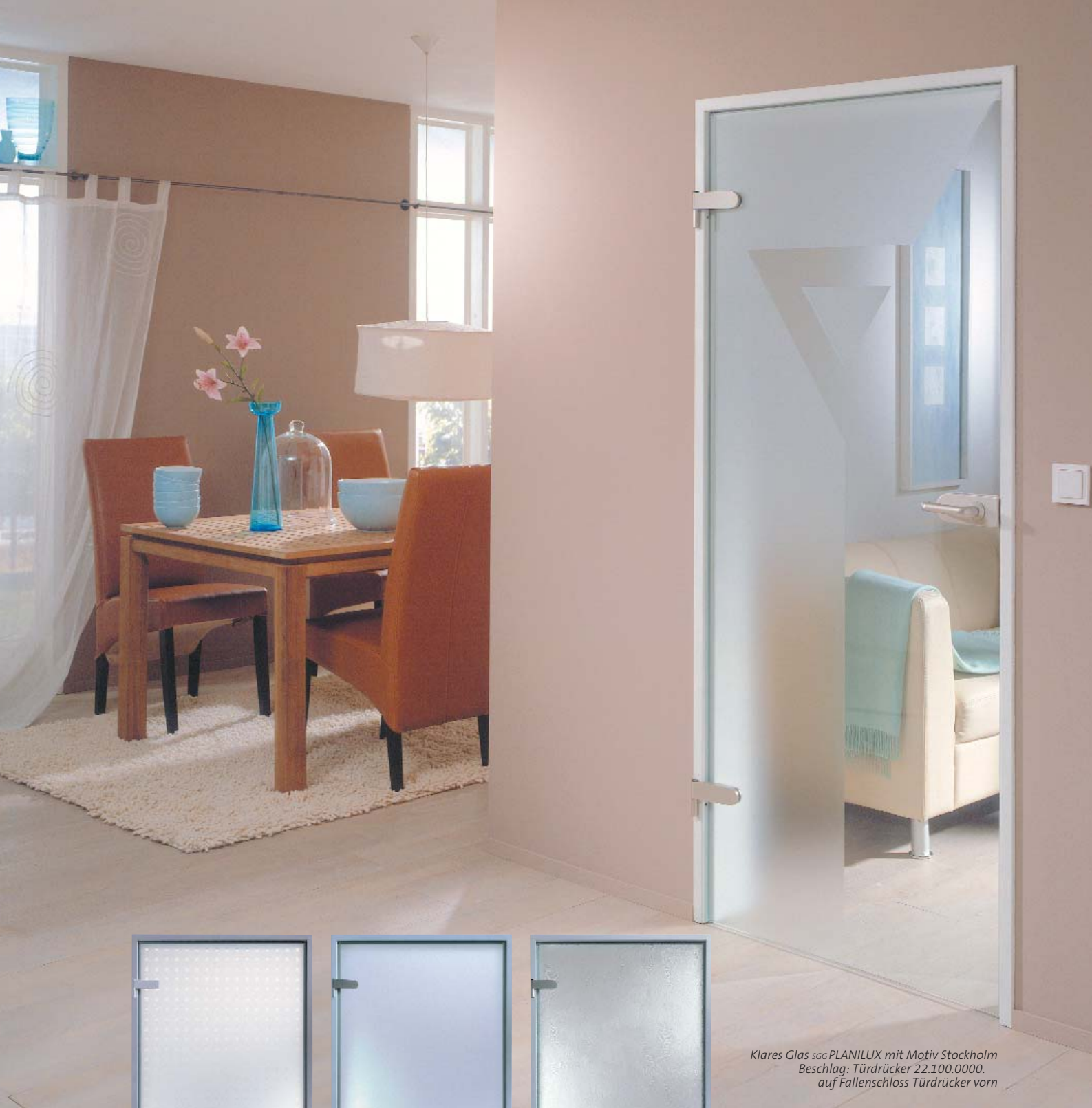
Klares Glas sgg PLANILUX mit Motiv Stockholm Beschlag: Türdrücker 22.100.0000.--- auf Fallenschloss Türdrücker vorn