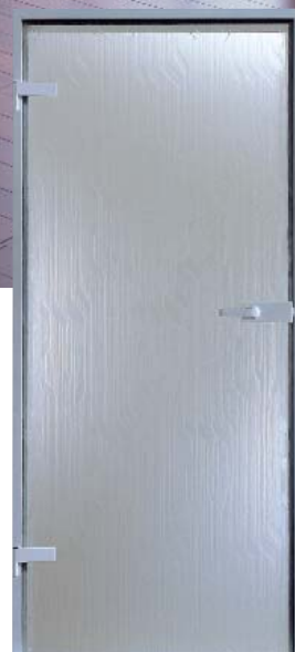
Strukturiertes Glas sggFLORA Beschlag: Türdrücker 22.104.0000.--- auf Fallenschloss eckig