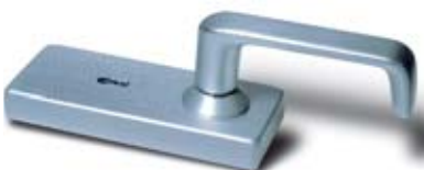
Türdrücker 22.104.0000 --- auf Buntbartschloss eckig