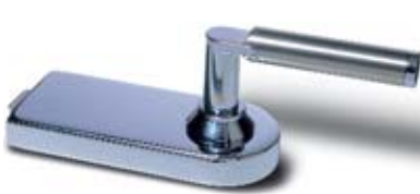
SET 1 • Schloss und Bänder, Messing poliert verchromt mit Türdrücker Messing poliert verchromt/Nickel matt