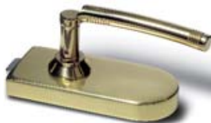
SET 4 • Schloss und Bänder, Messing poliert mit Türdrücker Messing poliert