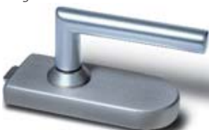
Türdrücker 22.108.0000 --- auf Fallenschloss Türdrücker vorn