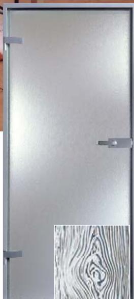
Strukturiertes Glas sgg MADERA Beschlag: Türdrücker 22.104.0000.--- auf Fallenschloss eckig