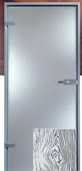
Strukturiertes Glas sggMADERA Beschlag: Türdrücker 22.104.0000.--- auf Buntbartschloss eckig