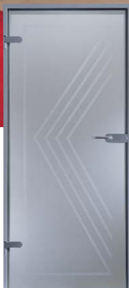
Klares Glas sGG PLANILUX mit Motiv Atlanta Beschlag: Türdrücker 22.100.0000.--- auf Fallenschloss

Kennzeichen vieler moderner Wohnstile ist die reduzierte, hochwertige Möblierung mit klarer Formgebung. Im sGG CLARIT-Programm finden Sie dazu die adäquat gestaltete Glastür: sachlich-nüchtern strukturiert, edel satiniert oder mit dezent mattiertem Design.