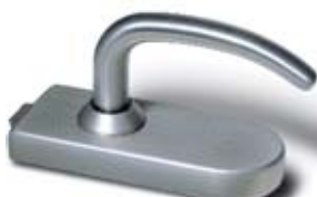
Türdrücker 22.120.0000 --- auf Fallenschloss Türdrücker vorn

Alle Beschläge sind in vielen verschiedenen Oberflächenausführungen, wie Aluminium eloxiert oder farbig kunststoffbeschichtet nach RAL, erhältlich.