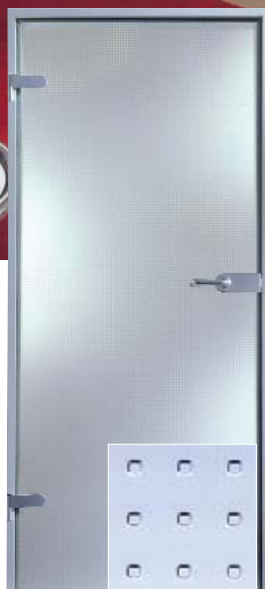
Strukturiertes Glas sGG MASTER-CARRE Beschlag: Türdrücker 22.100.0000.--- auf Fallenschloss