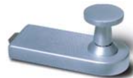
Drehknopf 22.150.0000 --- auf Fallenschloss