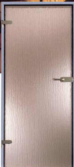
Strukturiertes Glas sgg SILVIT BRONZE Beschlag: Türdrücker 22.100.0000.--- auf Fallenschloss