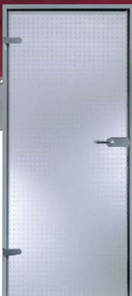
Mattiertes Glas sGG PLANILUX mit Motiv Quadrate Q 541 Beschlag: Türdrücker 22.100.0000.--- auf Fallenschloss