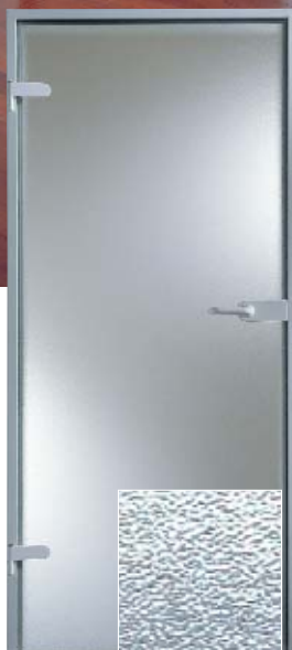
Strukturiertes Glas sggLISTRAL L Beschlag: Türdrücker 22.100.0000.--- auf Fallenschloss

Viele Einrichtungsgegenstände aus asiatischen Kulturkreisen sind im europäischen Wohndesign heimisch. sggCLARIT bietet dazu passende Designs, etwa mit japanischen Schriftzeichen verzierte klare Gläser oder Strukturen mit ansprechenden Ornamenten.